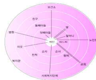
그림 4-9 사회지지도의 예